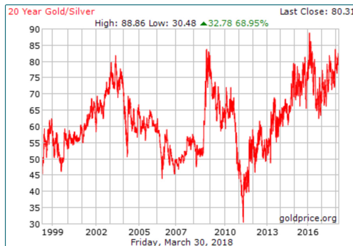
Afbeelding 1 Goud/Zilver ratio van de afgelopen 20 jaar

Om bovenstaande vraag te beantwoorden kijken we eerst naar de zilver /goud ratio. We weten dat de belangstelling van goud op een historisch dieptepunt is, hier heb ik u reeds meerdere malen over geschreven. Hoe is dit met Zilver? Het beste kunnen we dit zien door het direct te vergelijken met goud. Dit doen we door middel van de goud/zilver ratio, zie onderstaande grafiek. De grafiek laat de