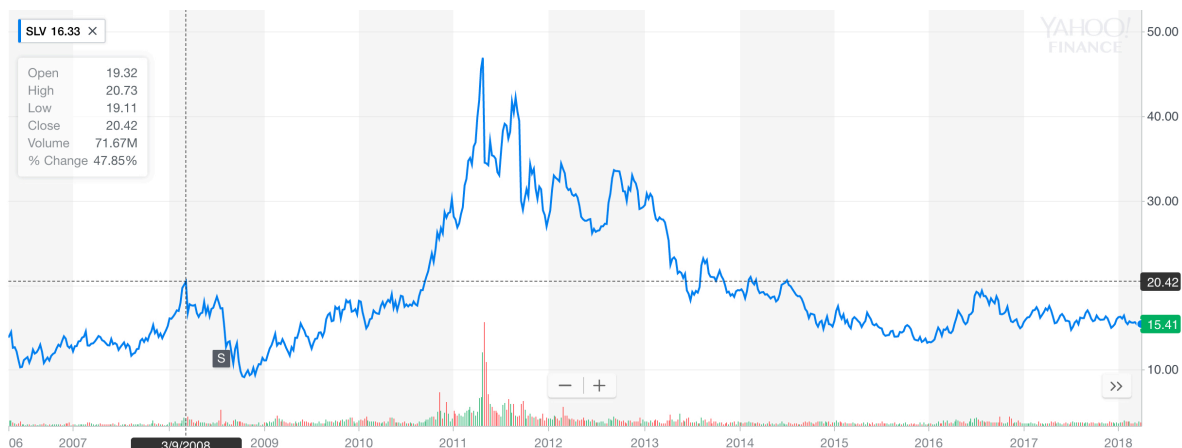
Afbeelding 2 SLV, prijs van de zilver ETF sinds 2007

Het aanbod zou ook kunnen stijgen zou u misschien denken. Dit kan, maar is bepaald niet eenvoudig. Dit komt omdat zilver vaak als bij product van andere metalen wordt gewonnen. Om meer zilver te produceren moet een mijn dus ook meer andere metalen naar boven halen. Dit is niet altijd wenselijk en vaak ook niet mogelijk met het oog op de capaciteit. Er bestaan maar een klein aantal pure zilvermijnen op de wereld. Een andere reden waarom het aanbod niet snel zal stijgen is om het sentiment rond zilver op een absoluut dieptepunt ligt. Niemand wil het blijkbaar hebben. Dit is mooi te zien aan de prijs van zilver, zie afbeelding 2 hieronder.